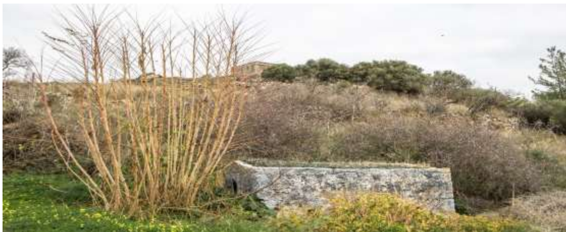
Το μόνο που έχει μείνει από το νεκροταφείο είναι το κενοτάφιο.

Ο ναός της Παναγίας και Μιχαήλ Αρχαγγέλου μέχρι το 1913 αποτελούσε ξεχωριστή ενορία με δικό της νεκροταφείο.