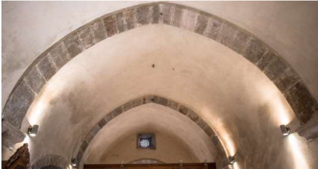
Ο θόλος του κλίτους του Μιχαήλ Αρχαγγέλου

Τα πλεονεκτήματα του δεύτερου τρόπου κατασκευής των θόλων είναι πολύ πιο γρήγορη κατασκευή, το μικρότερο κόστος, αλλά το σπουδαιότερο ήταν η οικοδομή επιβαρύνονταν με πολύ λιγότερο βάρος σε σχέση με την πρώτη περίπτωση που αναφέρθηκε.