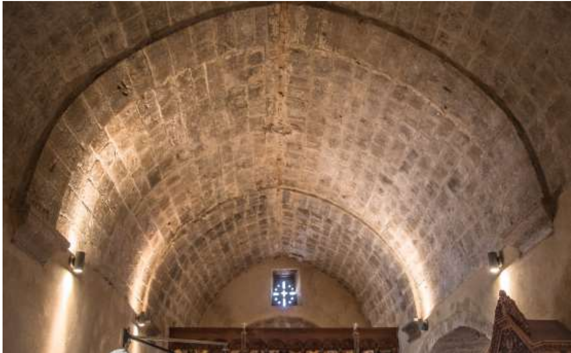
Ο θόλος του κλίτους της Παναχίας

τοποθέτηση των κλειδιών, αφαιρούσαν τον ξυλότυπο ή της πέτρες που είχαν τοποθετηθεί αντί για ξυλότυπο και έμενε ο θόλος. Με ψηλό κονίαμα σοβάντιζαν εσωτερικά και εξωτερικά τον θόλο για στεγανοποίηση .